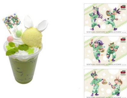
六年生のうさぎ抹茶ラテ