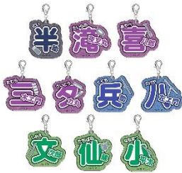
ネームキーホルダーコレクション【貳】 (全10種) 価格：1個880円 ※ランダム封入