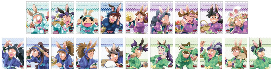
<店頭購入特典> ブロマイド (全20種) 『忍たま乱太郎』関連商品を1会計につき2,000円ご購入ごとにランダムで1枚プレゼント!