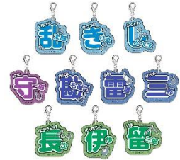
ネームキーホルダーコレクション【壹】 (全10種) 価格：1個880円 ※ランダム封入