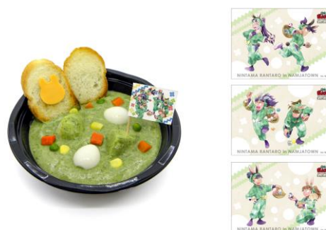
六年生のたまごを探せ！グリーンシチュー