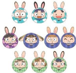
うさ耳おてだま【壹】(全10種) 価格：各1,100円 ★4月21日(金)販売開始