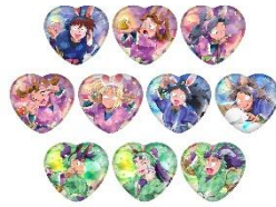
ハート型缶バッジコレクション【貳】 (全10種) 価格：1個550円 ※ランダム封入