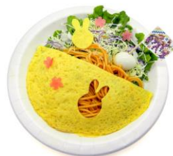
四年生の花束オムナポリタン