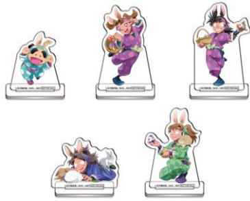
成功賞：アクリルスタンド(全20種)