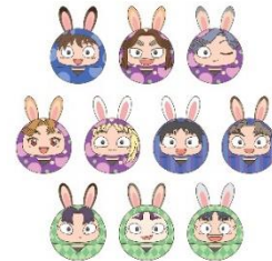
うさ耳おてだま【貳】(全10種) 価格：各1,100円 ★4月21日(金)販売開始