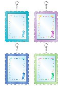
ブロマイドケース 価格：2,200円