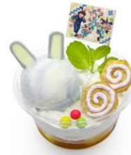
一年生のうさぎアイスカップ