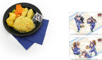
五年生の花咲くうさぎチャーハン