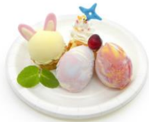
カラフルたまご探しプレート