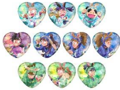
ハート型缶バッジコレクション【壹】 (全10種) 価格：1個550円 ※ランダム封入