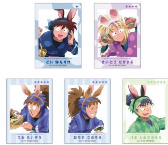
参加賞：クリアカード(全20種)