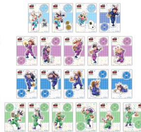
アクリルスタンド(全20種) 価格：各1,600円