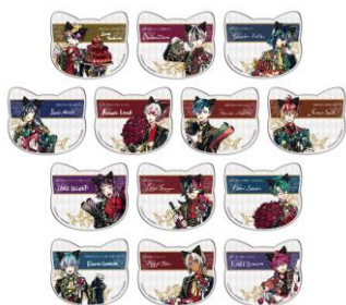
ねこ型アクリルコースター付きソフトドリンク