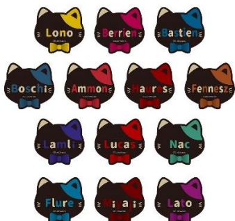
ネームバッジコレクション(全13種/ランダム封入)