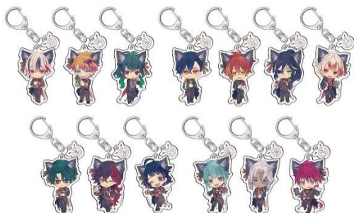
アクリルキーホルダー(全13種)