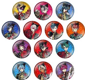
ホログラム缶バッジコレクション(全13種/ランダム封入)