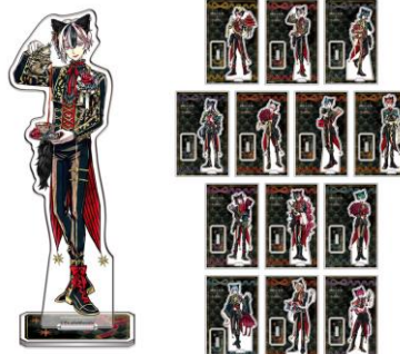
アクリルスタンド(全13種)