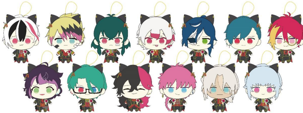
▲悪魔執事と黒い猫 in NAMJATOWN まめこっと(全13種) ※画像はイメージです。

『悪魔執事と黒い猫』とナンジャタウンのコラボイベント初開催を記念して、撮りおろしビジュアルの衣装を身にまとった執事たちの「悪魔執事と黒い猫 in NAMJATOWN まめこっと」が2022年11月10日(木)より先行でネットクレーンモール「とるも」、2022年12月24日(土)より全国の直営アミューズメント施設「namco」にプライズマシン向けアミューズメント景品として登場します。