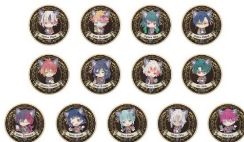
アイシングクッキー