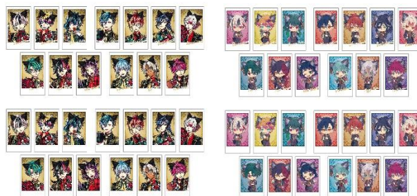
インスタントフォト風カードコレクション(全52種/ランダム封入)