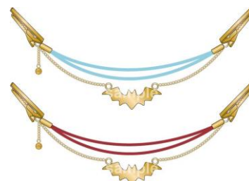
マント留め風チエーン (全 12 種 / 各 1,800 円)