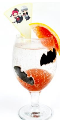
赤司と黛のクリームゾンナイトソーダ (780 円)

丸いトマトゼリーとコウモリのチョコレートを、透明なソーダに浮かべました。赤いグレープフルーツをトッピングしています。