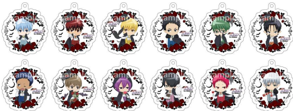
やわらかチャーム (全12種) ※ランダムでお渡し

料金：1回 500円 / 受付場所：J-CARNIVAL (J-WORLD 内)