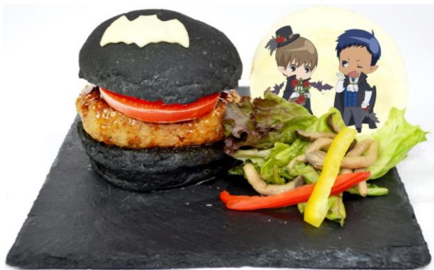
青峰と桜井のノワールバーガーセット (1,150 円)

黒い皿に黒いバンズでヴァンパイアの衣装をイメージしました。てりやきバーガーときのごサラダのセットです。