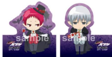
ダイカusstッカー (全12種)