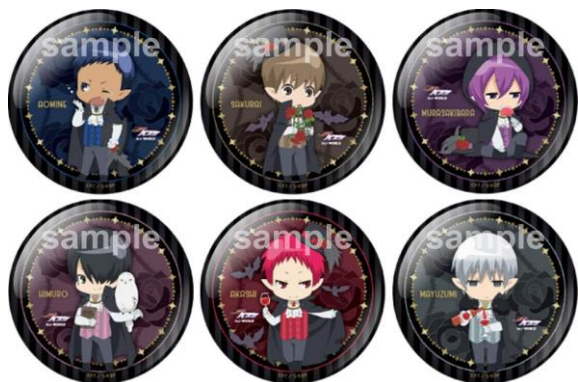
缶バッジコレクション[A]・[B] ([A]6種・[B]6種 / 1個 400円)