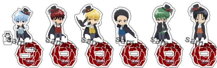
アクリルスタンド (全 12 種 / 各 750 円)