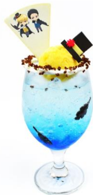
黄瀬と笠松のミステリアスブルーフロート (780 円)

青いソーダに、羽根型のチョコレートと満月をイメージしたマンゴーシャーベットを浮かべました。グラスのフチにはホイップクリームとクランチチョコを飾っています。