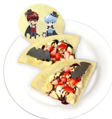
黒子と火神とテツヤ 2 号のヴァンパイアスイーツピッツァ (720 円)

チョコレート、マシュマロ、いちごを使用した甘いチョコレートチャックピザです。コウモリのチョコと、イラストをプリントしたミルクせんべいをのせています。