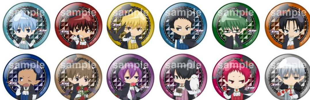
【期間限定景品】56mm メタリック缶バッジ (全 12 種)