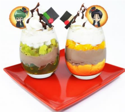
緑間と高尾のダブルヴァンパイアパフェ (900 円)

抹茶ゼリーとキウイのミニパフェと、マンゴープリンとミカンのミニパフェのセットです。ハット型のチョコレートと、イラストをプリントしたラングドシャを添えています。