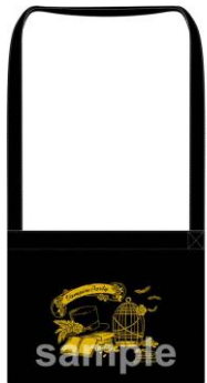
キャンパスサコッシュ (全6種)