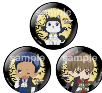
44mm 缶バッジ (全13種)