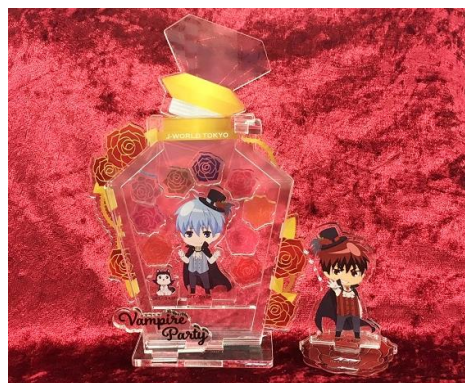
▲アクリルアートスタンド使用イメージ