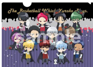
A4 クリアファイル (全 1 種 / 378 円)

○販売場所：J-WORLD STORE (J-WORLD 内グッズショップ) ※期間中、順次発売予定です。