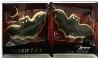
クッキーセット (全 1 種 / 1,000 円)