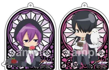
アクリルチャーム (全12種)