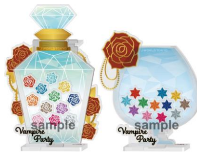
アクリルアートスタンド (全 2 種 / 各 1,500 円)