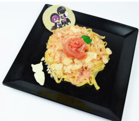
紫原と氷室のピンクローズパスタ (1,080 円)

たらこパスタに、スナック菓子をアクセントに散らしました。バラ型の生ハム、フクロウをかたどったチーズ、イラストをプリントしたミルクせんべいを添えています。