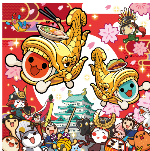
【キービジュアル】 尾張三河地区の歴史旧跡や名物のモチーフを『太鼓の達人』の世界観で表現しました。

地域のファミリーの方が思いっきり楽しめるあそび場『namco 太鼓の達人毎日おまつりだドン！イオンモール長久手店』にどうぞご期待ください！