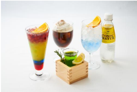
オリジナルカクテル各種

ゲームの合間に気軽に楽しめるフード、ビールやSNS映えするオリジナルカクテルなどのアルコール飲料、ソフトドリンクに加えて、ご当地缶詰の専門店「カンダフル」が厳選したご当地缶詰や、ゲームを遊びながら飲めるさまざまなボトル酒も販売します。さらに夜パフェの代表作『夜パフェ専門店 パフェテリア ベル』と共同開発したnamco TOKYO限定の「パックマンパフェ ～夜パフェ苺～」はフォトジェニックで味も絶品です。IPイベント開催中はコラボレーションフード＆ドリンクも展開します。