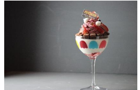
パックマンパフェ ～夜パフェ苺～