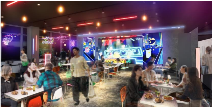
PAC-MAN™ & ©Bandai Namco Entertainment Inc.

巨大なスクリーンを設置したステージには、バンダイナムコ研究所の技術協力のもと「AIキャラクターパフォーマンスシステム」を導入しました。あらかじめアナライズされた楽曲を使用し、DJパフォーマンスが組み込まれたゲームAIが、3Dキャラクターのモーションやライブ空間の演出を連動させる仕組みで、各種ライブイベントに活用されていますが、店舗に常設されるのは今回が初の試みです。ホストDJとなるキャラクターAIDJの「DEN-CHAN」と、日替わりゲストのキャラクターAIDJが登場し、個性豊かなパフォーマンスやゲームミュージックなどで店内を盛り上げるのはもちろん、特定の飲食メニューが注文されるとスクリーンの演出が変化したり、参加型イベントの結果によって飲食メニューが一定時間割引になったり、AIDJと店内のお客さま、そしてお客さま同士も連動して楽しめる「ツナガル」仕掛けも搭載しました。ここでしか味わえないインタラクティブなエンターテインメントを体感いただけます。