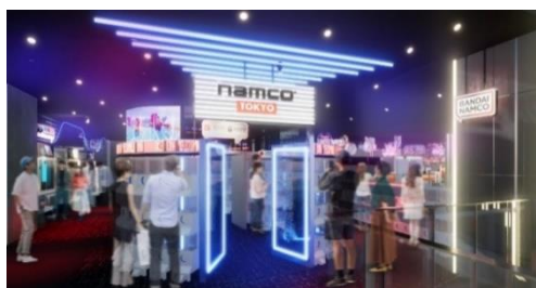
▲施設メイン入口のイメージ

株式会社バンダイナムコエンターテインメント(本社:東京都港区/社長:川崎寛)は、2023年4月14日(金)、東急歌舞伎町タワー(東京都新宿区)にオープン予定の新業態施設「namco TOKYO」の詳細がまとまりましたのでお知らせします。