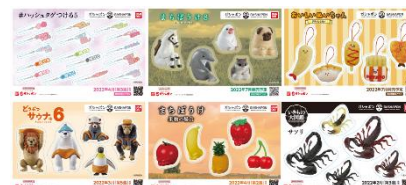
▲オリジナルステッカー(全6種)

https://bandainamco-am.co.jp/others/gashapon-bandai-officialshop/app/