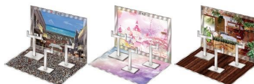
▲おうちでガシャ撮り(全1種) ※付属背景(全3種)

*ニュースリリースの情報は、発表日現在のものです。発表後予告なしに内容が変更されることがあります。あらかじめご了承ください。