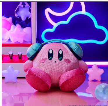
ときめき☆クレーンフィーバー ぬいぐるみ (全1種) 価格：2,600円 [サイズ：16cm]