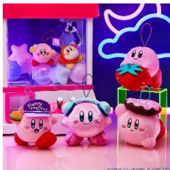
A賞：ぬいぐるみマスコット