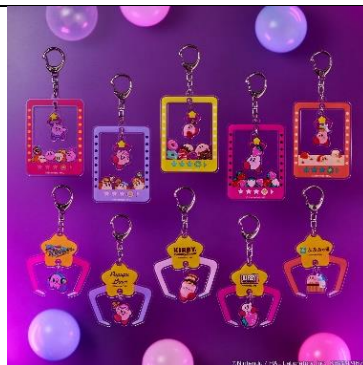
アクリルキーホルダーコレクション (全10種/ランダム封入) 価格：880円