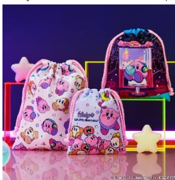
3P巾着 (全1種) 価格：1,500円