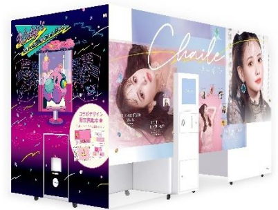
イベント限定特別外装のプリ機『Chaile』(フリーユ株式会社)

2022年8月9日(火)から9月30日(金)に全国のゲームセンターにて期間限定で『星のカービィ』のコラボレーションフレームを展開したプリントシール機『Chaile(チャイル)』がイベント会場のみで限定再登場します！カービィフレームのプリが撮れるのは全国でここだけ！おなじみのゲームBGMを聞きながら、さまざまなカービィとの撮影をお楽しみいただけます。