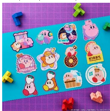
ダイカットステッカーコレクション (全12種/ランダム封入) 価格：490円