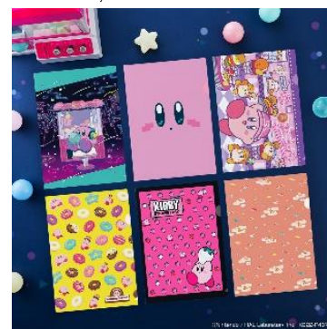
クリアファイル (全6種) 価格：各490円