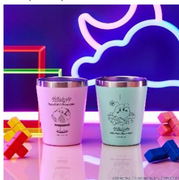
ステンレストンブラー (全2種) 価格：各2,420円