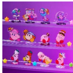
B賞：アクリルスタンド