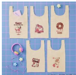
A賞：マルシェバッグ