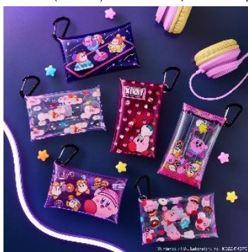
クリアマルチケース (全6種) 価格：各880円