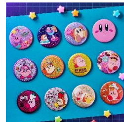
C賞：ホログラム缶バッジ (ランダム配付)