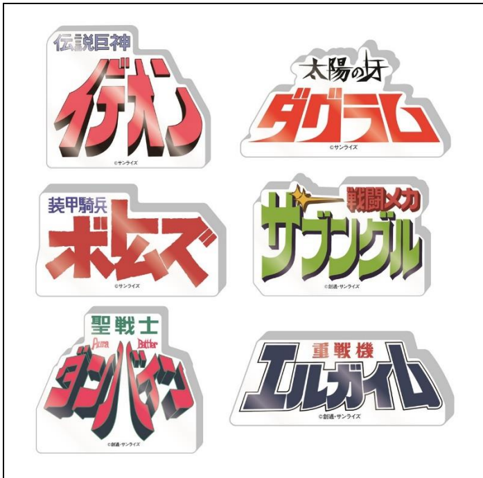
ロゴドミテリア(全6種) 価格：1,100円

「サンライズワールドHAKATA」ではインターネット申し込みでの受注販売のみだった「懐かしのサンライズ作品」のアートを額装した、キャラファイングラフも店頭販売します。ロゴドミテリア、ロゴTシャツ、サンライズロゴ商品は、店頭販売限定商品です。