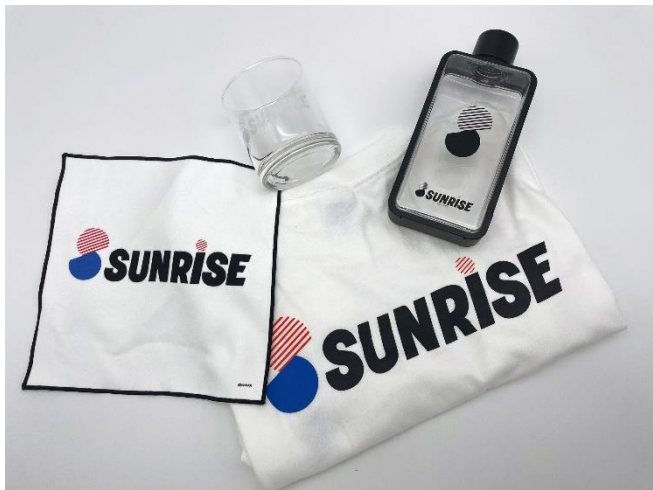
サンライズロゴTシャツ 価格：3,300円 サンライズロゴロックグラス 価格：2,200円 サンライズロゴスクエアボトル 価格：1,650円 サンライズロゴミニタオル 価格：1,320円