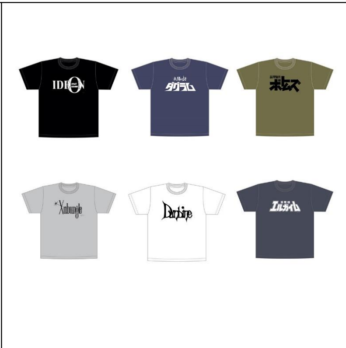
ロゴTシャツ(全6種) 価格：2,200円