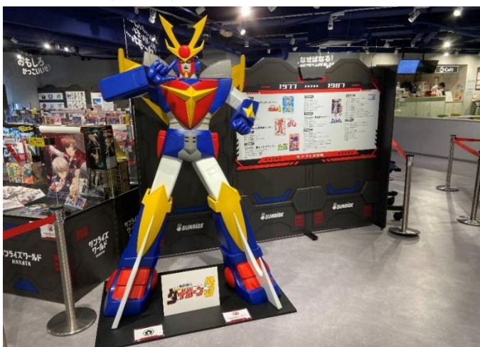
▲「サンライズワールドHAKATA」の様子

バンダイナムコ Cross Store 博多で10月16日(日)まで展開中の「サンライズワールド」が関東に初上陸します。「サンライズワールドYOKOHAMA」は、期間限定の店舗(入場無料)です。会場内では、これまで制作された220を超えるサンライズブランド作品の中から、『伝説巨神イデオン』、『戦闘メカ ザブングル』、『魔神英雄伝ワタル』、『勇者王ガオガイガー』、『カウボーイビバップ』、『舞-HiME』、『巨神ゴッグ』、『新世紀G P Xサイバーフォーミュラ』、『熱血最強ゴウザウラー』をピックアップして、制作資料等を中心に展示します。