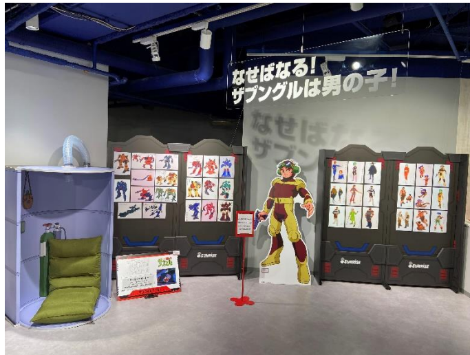
▲「サンライズワールドHAKATA」の様子

「サンライズワールドYOKOHAMA」では、博多で展示された作品が一部変更となり、『巨神ゴッグ』、『新世紀G P X サイバーフォーミュラ』、『熱血最強ゴウザウラー』を新たに加え、合計9作品をピックアップ作品として展示します。また新たな展示物として、サイバーフォーミュラOVAシリーズ『新世紀GPXサイバーフォーミュラSIN』の作中で2022年の出来事として描かれた第17回ワールドグランプリで優勝を導いたサイバーマシン「凰 オーガ AN-21」の実寸大レプリカを展示します。