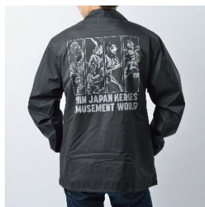
コーチジャケット (全1種)