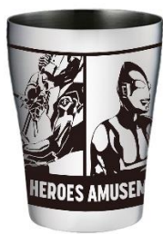
ステンレストンブラー (全1種)