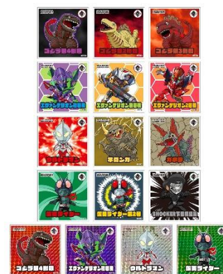
トレーディングステッカー (全16種)