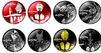
B賞 メタリック缶バッジ (全8種)