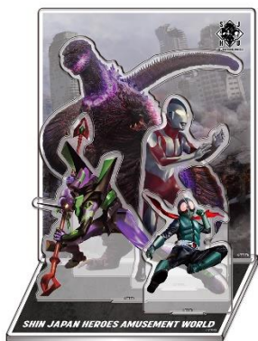
アクリルジオラマ (全1種)