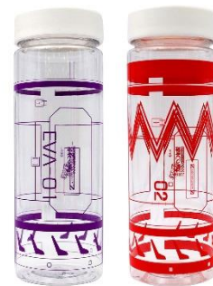
エヴァンゲリオンVR クリアボトル (全2種)