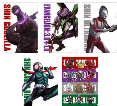
クリアファイル (全5種)