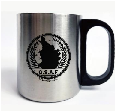
ゴジラVR ゴジラ特殊攻撃部隊ステンレスマグカップ (全1種)