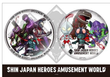
缶バッジセット (全1種)

限定イラストを使用したオリジナルグッズを、イベント会場と「ナムコパークス オンラインストア」、「プレミアムバンダイ」でお買い求めいただけます。