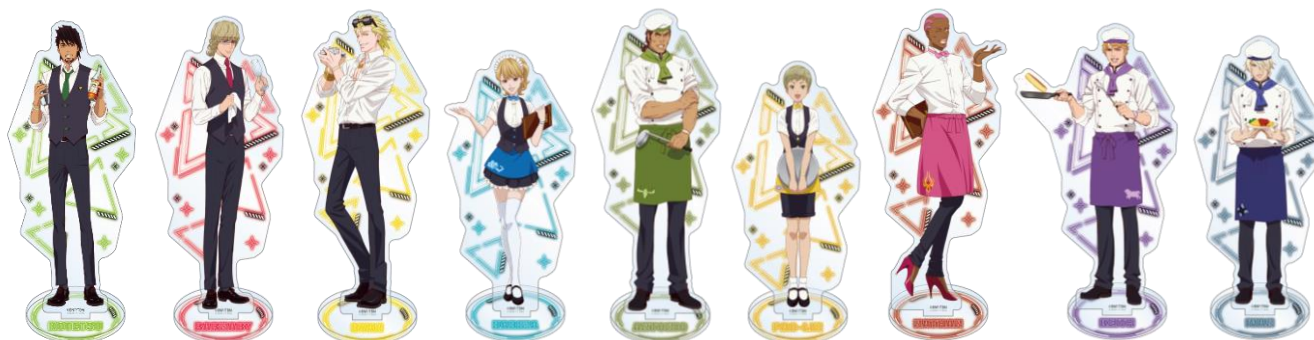
アクリルスタンド 全9種 価格：各 1,500 円