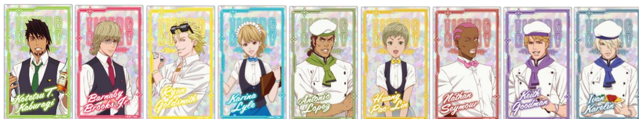
ホログラムアクリルカード(ランダム) 全9種 価格：715 円