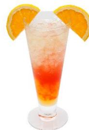
さすらいの重力王子 (アルコール/ノンアルコール) 価格：1,280 円