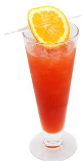
ブルジョワ直火焼き (アルコール/ノンアルコール) 価格：1,280 円