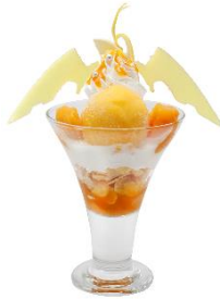
ライオンのフローズンヨーグルトパフェ 価格：1,980円