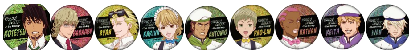
ホログラム缶バッジ(ランダム) 全9種 価格：600 円

※インフォメーションの情報は発表時現在のものです。発表後予告なしに内容を変更、中止することがあります。※画像はイメージです。