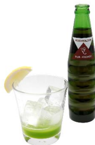
俺の心は相当ロック！お前の悪事を完全ロック！ (アルコール/ノンアルコール) 価格：1,280 円