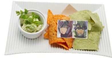
タイガー&バーナビー ナチョチップス 価格：1,980円