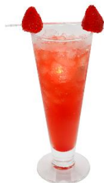
スーパールーキー Style2 (アルコール/ノンアルコール) 価格：1,280 円