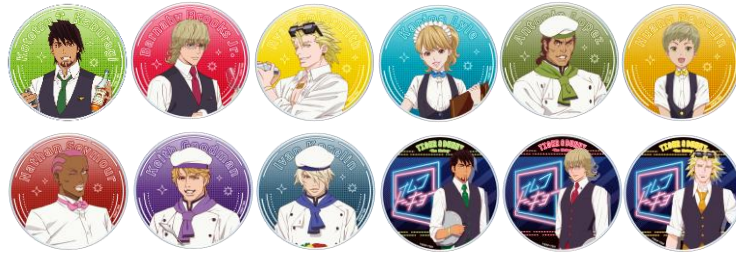
アクリルコースター 全 12 種 ランダム