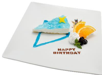
折紙サイクロン・バースデーケーキ 価格：2,380円

ドリンク・フードを1品購入ごとにノベルティとして「場面写プロマイド」(全11種)がランダムで付属します。