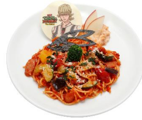
バーナビー特製トマトパスタ 価格：2,480円