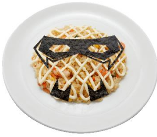
TIGERチャーハン 価格：1,980円