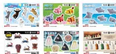
▲オリジナルステッカー(全6種)