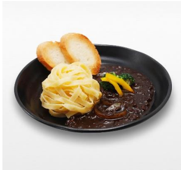
◆イレイザーヘッドのブラックカレー 価格：1,650円