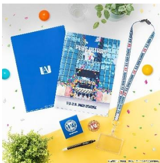
オープンスクール記念セット(全1種) 価格：3,900円