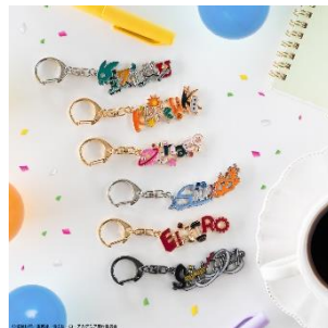
【8月2日(金)発売】 ネームキーホルダー(全6種) 価格：各1,800円