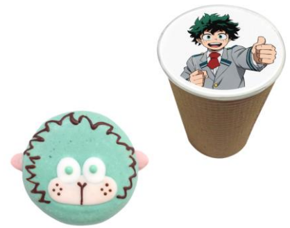
デクシーブドーナツ フォーチュンラテセット 価格：1,300円