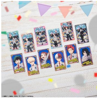
トレーディングクリアカード(風船) (全12種) ※ランダム封入 価格：1個400円