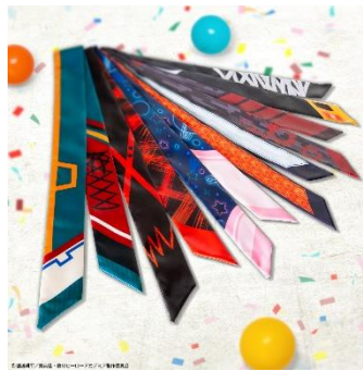
ロングクロス(6種) 価格：各1,800円