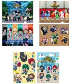
クリアファイル (全3種) 価格：各600円