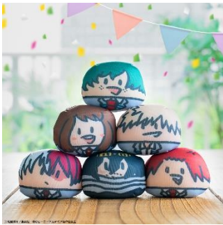
まるぬいぐるみ(全6種) 価格：1個1,000円※ランダム封入 コンプリートセット6,000円