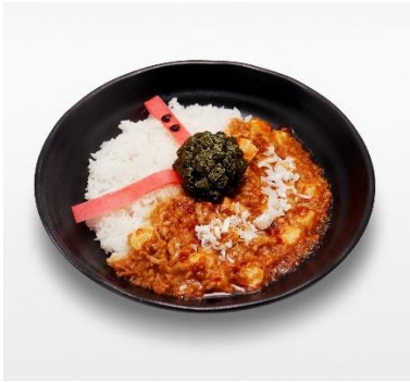
◆大・爆・殺・神ダイナマイトの 爆裂マーボー丼 価格：1,650円