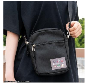
ショルダーバッグ(全1種) 価格：4,500円