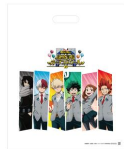
＜会場限定購入特典＞ 1会計につき3,000円以上購入でショッ パーを1枚お渡しします。