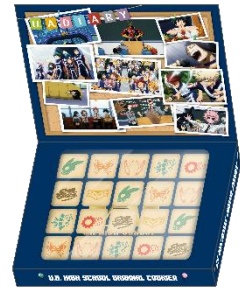
雄英高校オリジナルクッキー (全1種) 価格：950円