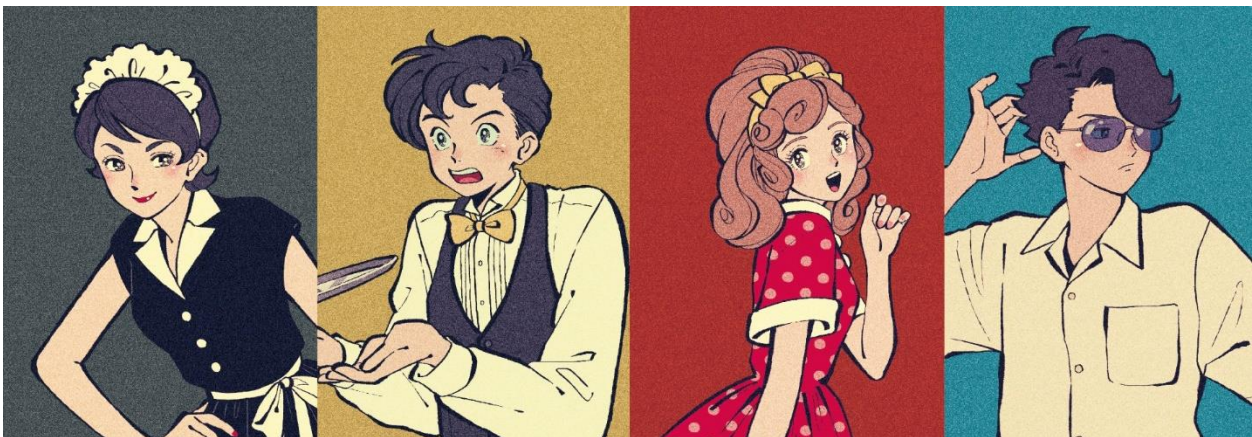
【タマちゃん】 純喫茶 純で働く ウエイトレス

<登場人物イラスト> ※園内各所に各登場人物を演じる役者たちがいて、実際に話を聞くことができます。