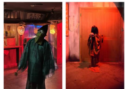
▲「ナンジャ怨霊フェス2022」の様子

16時以降、園内の「もののけ番外地」では、怨霊たちが徘徊し始めます。 通行人に興味津々で近寄ってくる怨霊や、ひっそりとたたずんでいる控えめな怨霊など、個性豊かな怨霊たちが日替わりで現れます。 ぜひ、怨霊フェス名物の“徘徊怨霊”たちとのひとときをお楽しみください。