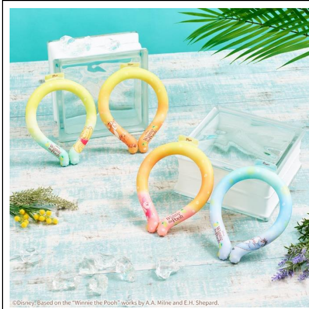
©Disney. Based on the "Winnie the Pooh" works by A.A. Milne and E.H. Shepard.