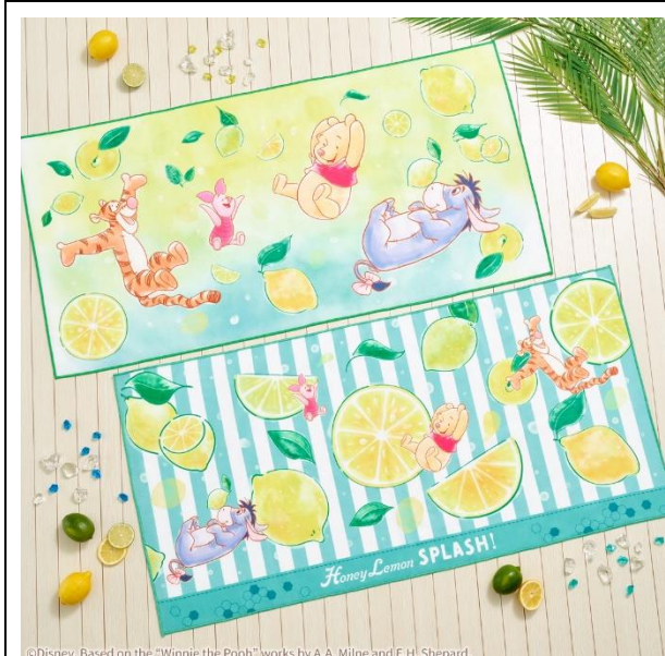
©Disney. Based on the "Winnie the Pooh" works by A.A. Milne and E.H. Shepard.