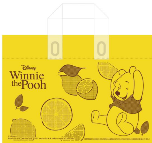
▲限定ショッパー(全1種)

※ショッパーはサトウキビを原料とした植物由来のプラスチックを約25%使用しCO2増加抑制に取り組んでいます。