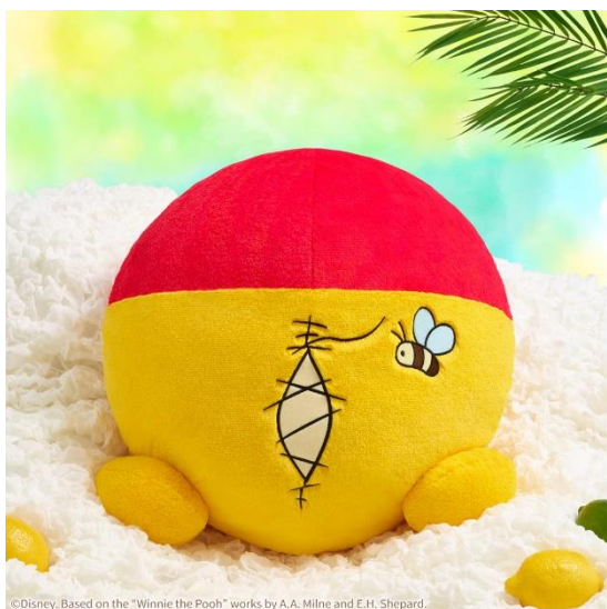
©Disney. Based on the "Winnie the Pooh" works by A.A. Milne and E.H. Shepard.