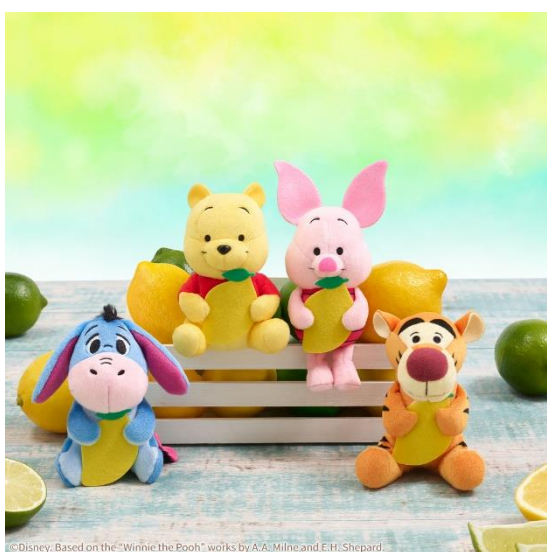
©Disney. Based on the "Winnie the Pooh" works by A.A. Milne and E.H. Shepard.