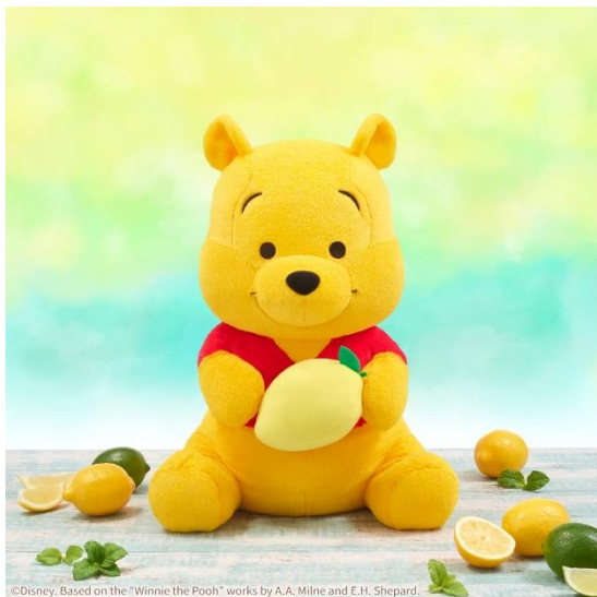
Based on the "Winnie the Pooh" works by A.A. Milne and E.H. Shepard.

夏らしいさわやかなレモンモチーフのナムコ限定デザインを使用した景品が、7月14日(金)より全国約200店舗の直営アミューズメント施設「namco」とネットクレーンモール「とるも」に順次登場します。ぬいぐるみはもちろん、バスタオルやクールネックリングなど普段使いにぴったりなアイテムも要チェックです。