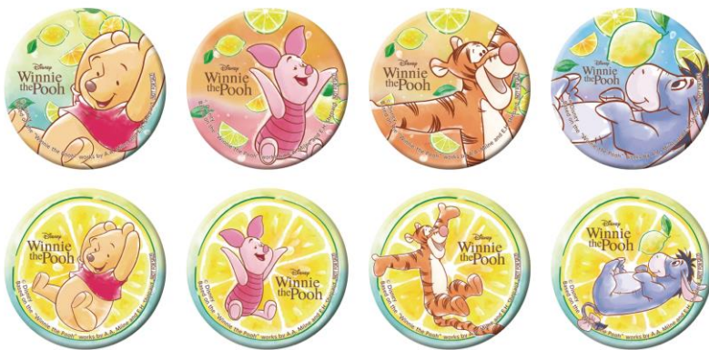
▲オリジナル缶バッジ (全8種)