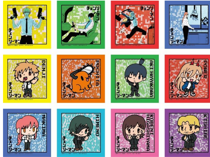
▲前半ノベルティ「チェンソーマン ステッカー」