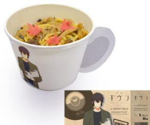
雨月の紅葉舞う...きのこのクリームパスタ 価格：1,100円