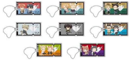
アクリルキーホルダー付きソフトドリンク