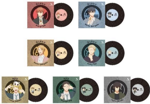
S賞：レコード風コースター(全7種)