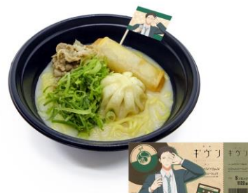
玄純の胃袋強すぎ肉ラーメン 価格：1,300円