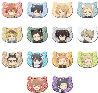
B賞：ねこ型缶バッジ(全14種) ※ランダム配付