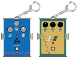
エフェクター風アクリルキーホルダー (全2種)