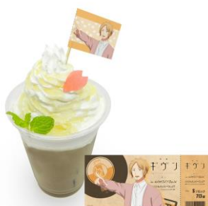
春樹のハニーカフェラテ 価格：950円