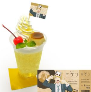
柊のきんいろのドリンク 価格：1,000円