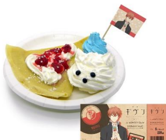
真冬のプレートクレープ〜毛玉といっしょ〜 価格：1,200円