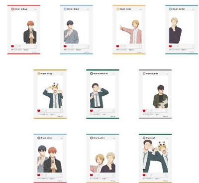
SNS風クリアカード(全10種) ※ランダム配布

※インフォメーションの情報は発表時現在のものです。発表後予告なしに内容を変更、中止することがあります。※画像はイメージです。