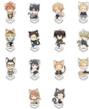
A賞：ちびキャラアクリルスタンド(全14種)