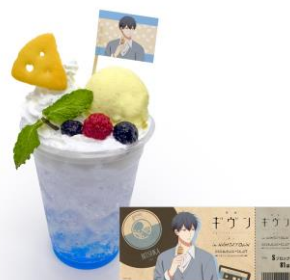
立夏のブルーフロート 価格：990円