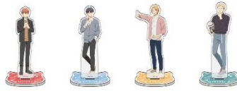
シルクアクリルスタンド (全7種)