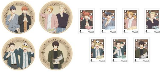
イラストカード付きアイシングクッキー