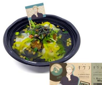
秋彦の天才.....な水餃子入りさけ茶漬け 価格：1,180円