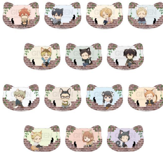
<店頭購入特典> ねこ型イラストカード (全14種)

『映画 ギヴン 海へ』 関連商品を 1 会計につき 2,000 円 購入ごとにランダムで 1 枚 プレゼント！