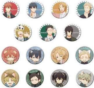
グリッター缶バッジコレクション (全15種)