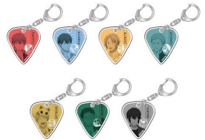
ピックアクリルキーホルダーコレクション (全7種)