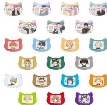
C賞：ねこ型ステッカー(全21種) ※ランダム配付