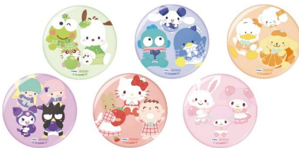
▲ B賞 缶バッジ (全6種・ランダム)