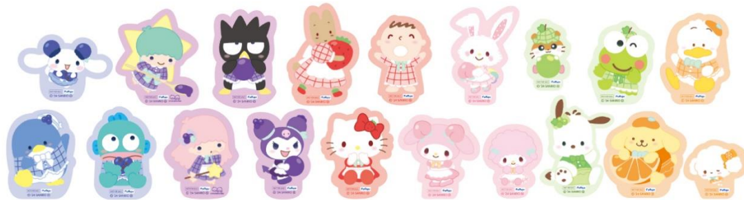
▲ C賞 ダイカットステッカー (全19種・ランダム)

※インフォメーションの情報は発表時現在のものです。発表後予告なしに内容を変更、中止することがあります。※画像はイメージです。