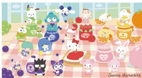
▲ A賞 バスタオル (全1種、サイズ：横140cm×縦76cm)