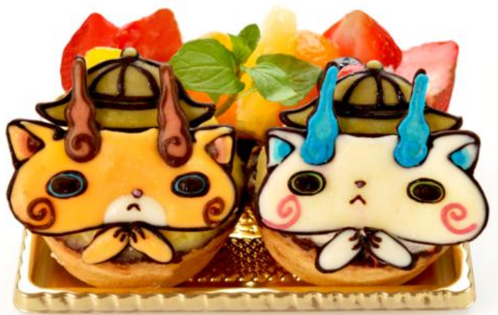
▲新登場のメニュー「コマさん探検隊が行く！デザート&フードの出発ズラ！」