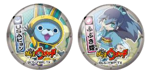
2.5センチキラキラミニ缶バッジ(全12種)

スタンプ台紙をクリアし、さらに「妖怪ウォッチアトラクション 鬼時間脱出大作戦」で赤鬼との対決に勝利(結果がランクAまたはB)すると、缶バッジをランダムで1つプレゼント。