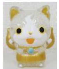
【B賞：人形すくいマスコット(全6種)】