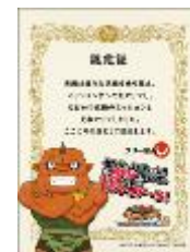
【フリー隊長認定証】