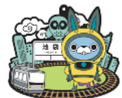
【地名ラバーストラップ】702円