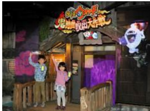
◆大人気アトラクション 「妖怪ウォッチアトラク ション 鬼時間脱出大作戦」

ヨーカイパッドを手に、赤鬼に見つからないよう「音を出すな」「光を避ける」などのミッションに挑戦。最後には赤鬼との対決があり、体を使ったアクションで戦います。無事鬼時間から脱出できるのでしょうか？