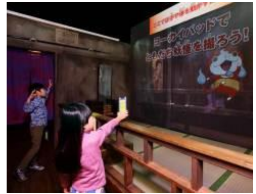
妖怪ウォッチアトラクション 鬼時間脱出大作戦