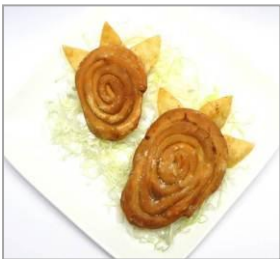
■商品名：発見！恐竜の足跡餃子 ■価格：600円 ■店舗：華興