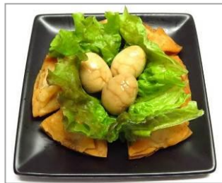
■商品名：餃子で出来てる？！覗いてみよう、恐竜の巣 ■価格：680円 ■店舗：全国たれ比べ餃子