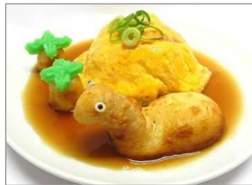
■商品名：海の中からプレシオサウルス現る！天津飯プレート ■価格：750円 ■店舗：羽根付き餃子の共演