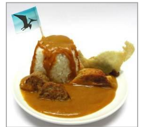
■商品名：恐竜の時代にタイムトリップ！溢れ出る火山カレー ■価格：780円 ■店舗：鉄なべ荒江本店