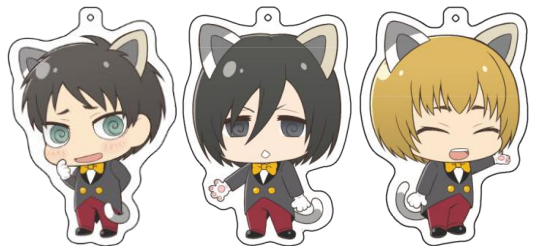
アクリルキーホルダー/10種