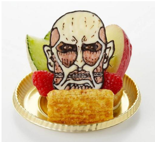
「超大型巨人を駆逐し、果物を確保せよ！」デザートシュー生地を生クリームやフルーツ、チョコレートの超大型巨人が！(830円)

また、「進撃の巨人」のキャラクターと、ナンジャタウンのシンボルキャラクター「ナジャヴ」がコラボレーションした「ちみキャラ」ネコ耳 ver.のイラストが登場。このイラストを使用したイベント限定グッズや景品も登場します。