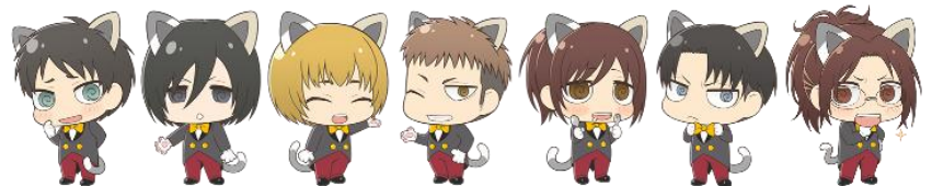
ナンジャタウン限定「ちみキャラ」ネコ耳 ver.のイラスト