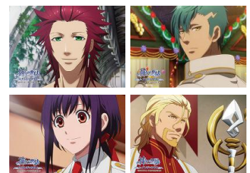
【景品一例】 プロマイド/全 25 種