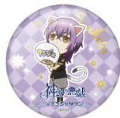
【景品一例】 缶バッジ(75mm)/全 9 種