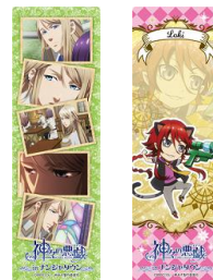
【景品一例】 クリアブックマーカー/全 16 種