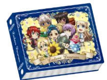
【オリジナルグッズ一例】 プロマイドアルバム (1,100 円)