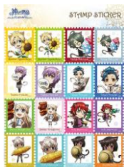
切手風ビッグシール/全 1 種 (900 円)

「神々の悪戯」グッズを、1 会計につき 1,000 円お買い上げごとにオリジナルポストカードを 1 枚プレゼント!