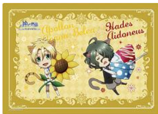
【景品一例】 ランチョンマット/全 4 種

ナンジャタウン限定景品がもれなくもらえるガラボン屋台です。(1 回 300 円)