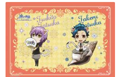
【景品一例】 ランチョンマット