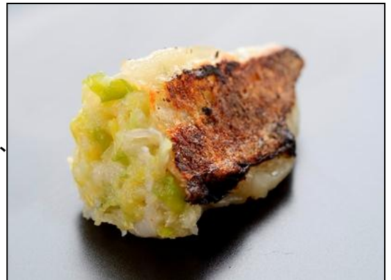
薄皮の中にはこだわりの素材を使用した餡がぎっしり。

にんにくは“えぐみ”がなく匂いが残りにくい青森県産を使用し、食感が残るよう細かく刻み、100%国産黒毛和牛のミンチとよく混ぜ合わせています。