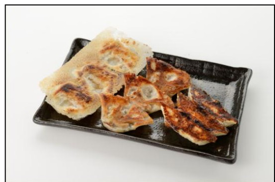
「全国ひとくち餃子の共演」食べ比べ三店盛り 9個 600円(税込)