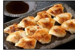
芦屋の一口餃子 【壱心】 「一口餃子 壱心」