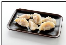
長崎新地中華街の名店 【老李】 「老李の長崎水餃子」