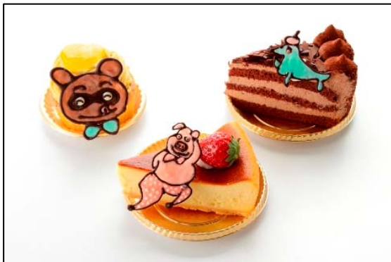
「Patisserie Cute」では かわいいデコケーキが登場