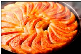
西日本餃子王 鉄なべ荒江本店 「鉄なべ餃子」