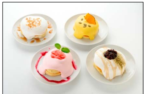
「レンガえんとつ」ではトッピングでデコレーションされた 新感覚のデコパンケーキが登場