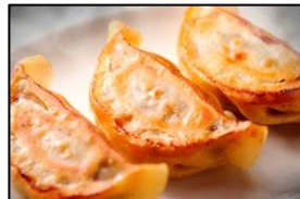
人気餃子王 包王 「牛とん包」