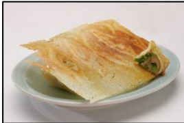
羽根付き餃子発祥【ニイハオ】 「元祖羽根付き餃子」