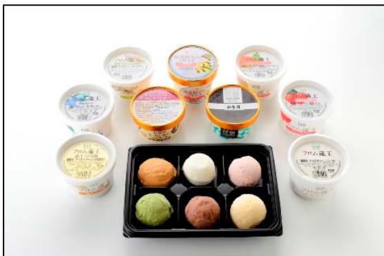
「ご当地アイスパーラー」では ご当地アイスの盛り合わせで食べ比べ