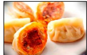
話題餃子王 華興 「華興餃子」