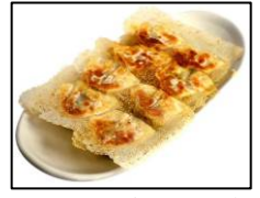
東京ひとくち餃子の名店 【赤坂ちびすけ】 「ちびすけ餃子」