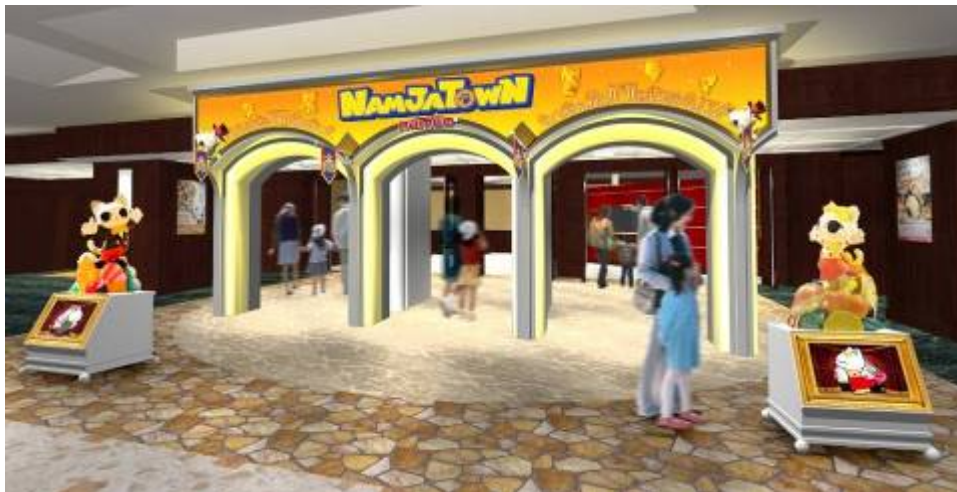
新エントランスイメージ

新アトラクションや、ナンジャ餃子スタジアム、福袋デザート横丁の登場、リニューアルコンセプトを体現した「ナンジャマイページ」などの詳細と、新ストーリーに関わる新たなキャラクターの登場が決定いたしましたのでお知らせいたします。