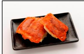
新感覚餃子【安亭】 「元祖チーズ羽根付き餃子」