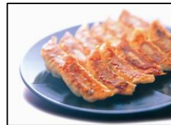
宇都宮市最多店舗数 【宇都宮餃子館】 「宇都宮 健太餃子」