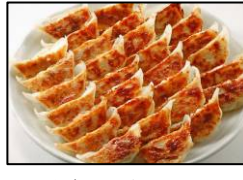
博多一口餃子発祥 【薬院 宝雲亭】 「宝雲亭一口餃子」