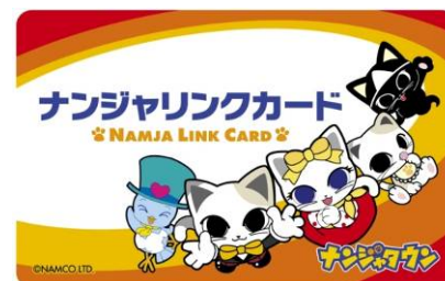
ナンジャリンクカードイメージ

リニューアル前の「ガウストパニック」、「幸せの青い鳥」の遊戯結果が記録されたチケット・記録カードをお持ちの方は、ナンジャリンクカードにデータを移行する事で、継続してお遊びいただけます。