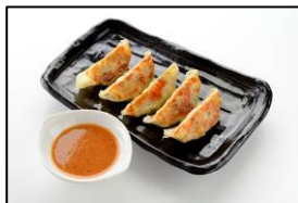
神戸南京町の名店 【皇蘭】 「神戸味噌だれ餃子」