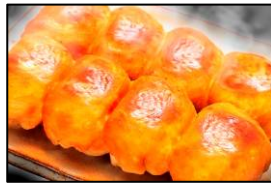
東日本餃子王 丸満 「丸満餃子」