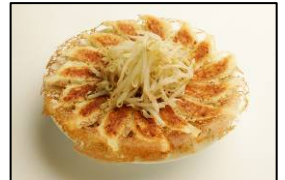
浜松餃子の草分け的存在 【石松】 「石松餃子」