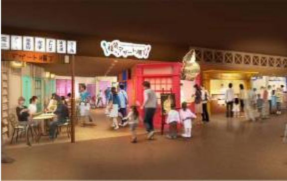
福袋デザート横丁イメージ

「福袋七丁目商店街」には、デコレーションされたデザート“デコデザート”を通年提供する「福袋デザート横丁」が新登場します。“デコデザート”づくりに定評のある職人が織り成す、動物などをモチーフにしたケーキやアイス等で、思わず誰かに伝えたいくなるおいしさと驚きを体験できます。プリン&チーズケーキのお店「Deco&Deco」は東京初出店となります。