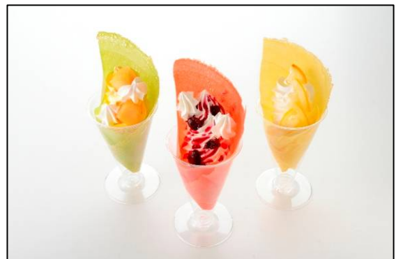
「サンタチューボー!」の パリパリ感が楽しいデコクレープ