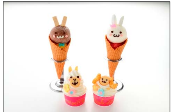
ジェラートの名店「ダ ルチアーノ」では デコジェラートが登場