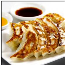
横浜中華街の老舗 【四五六菜館】 「四五六菜館餃子」