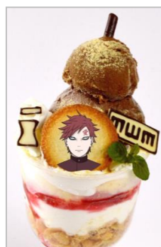
五代目風影のひょうたんパフェ (780円)

チョコ細工で火影の笠、六代目の「六」、パクンを作り飾りました。 木ノ葉をイメージした抹茶アイスの下にはコーンフレークや抹茶ブラウニーが入っています。