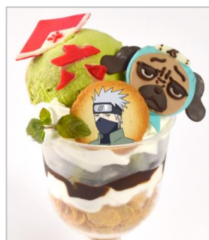
六代目火影&パクンのパフェ (780円)

チョコ細工で火影の笠、六代目の「六」、パクンを作り飾りました。 木ノ葉をイメージした抹茶アイスの下にはコーンフレークや抹茶ブラウニーが入っています。