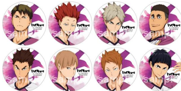
56mm 缶バッジ (全8種)