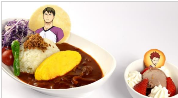
白鳥沢フェス限定 牛島若利のオムハヤシライス 天童のチョコアイス付 (990円)

販売中のレギュラーメニュー「絶対王者」白鳥沢学園 牛島若利のハヤシライス ミニドリンク付を、白鳥沢フェス期間限定でパワーアップ! 牛島の好物ハヤシライスにオムレツをトッピングしました。ミニドリンクの代わりに天童の好物チョコアイスがセットになっています。