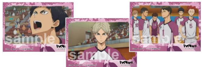
イラストシート (全10種)

『ハイキュー!!』(著:古舘春一)は、「週刊少年ジャンプ」(集英社)で連載中の熱血青春バレーボール物語で、2014年から3期にわたりテレビアニメ化された次世代王道スポーツ作品です。