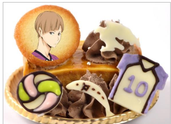
白布賢二郎の“誰よりも目立たないセッターに俺は成る！”ケーキ (キャラメルケーキ) (700円)

白布の髪色をイメージしたキャラメルケーキに、チョコで作った白鷲、ユニフォーム、しらす、パレーボールを添えました。