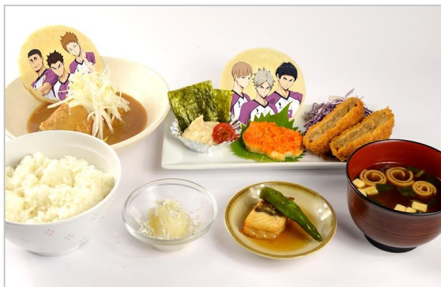
絶対王者！白鳥沢学園学食おすすめ“マル得定食” (990円)

白鳥沢メンバーの瀬見、大平、山形、白布、川西、五色それぞれの好物をモチーフにした食材を盛り合わせた定食です。