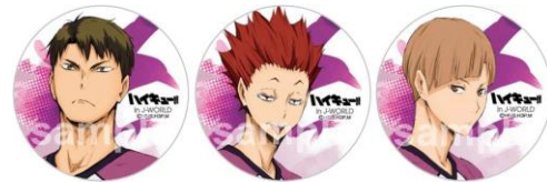
56mm 缶バッジ (全8種)

ミニアトラクション「売り切れ注意! 坂ノ下商店アルバイト体験」に白鳥沢メンバーの新景品が登場します。