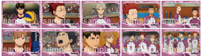
イラストシート (全10種) ※ランダムでお渡し