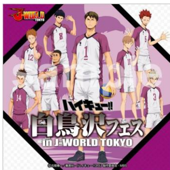
マイクロファイバータオル (全1種/648円)