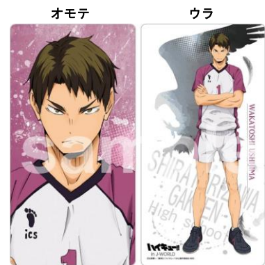
ロングクッション (全1種/2,700円) ※店頭での受注販売