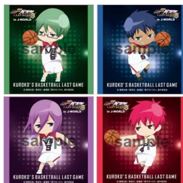
《参加賞》 ステッカー(全7種)