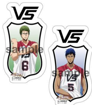
《C賞》 ダイカットボードクリップ (全7種)