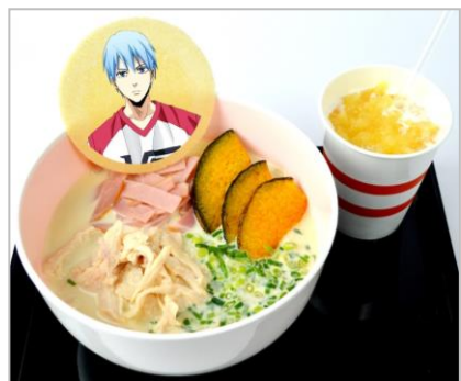
TETSUYA KUROKO Misdirection somen with peach shake (味噌豆乳素麺と桃のシェイク) (880円)