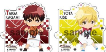
《A賞》 アクリルストラップ (全7種)