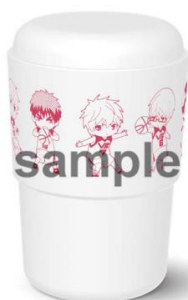
カフェタンブラー/全1種 (1,620円)