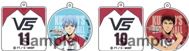
《成功賞》 ダブルチャーム(全7種)