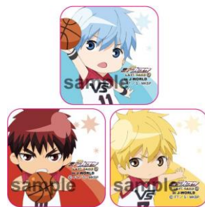
《D賞》 アイコン型缶バッジ (全7種)