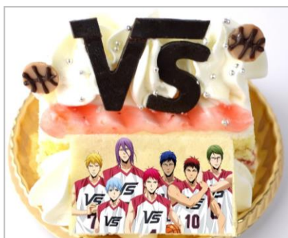
「バスケットをするのに資格なんていらなはずです！」 VORPAL SWORDSケーキ (いちごショート) (700円)