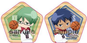
《B賞》 五角形缶バッジ (全7種)