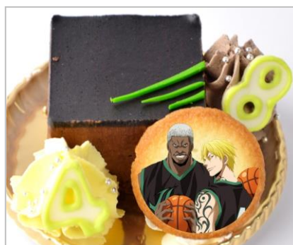
「ここにいる奴ら全員、バスケットをやる資格はねえよ！」 Jabberwockケーキ (チョコレートケーキ) (700円)