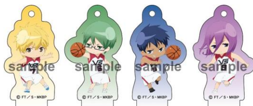
きらきらアクリルチャーム/全7種 (1個 580円) ※プラインドパッケージ