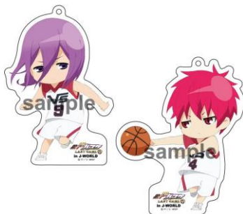
《B賞》 やわらかストラップ (全7種)