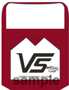
《A賞》 ショルダートートバッグ (全1種)