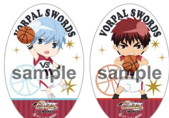
オーバル型缶バッジ/全7種 (1個 432円) ※プラインドパッケージ