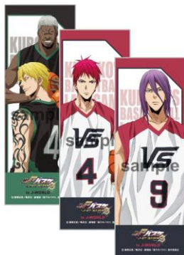
《C賞》 ミニポスター(全8種)