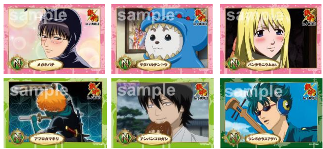
ステッカー / 全14種