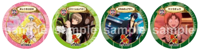
56mm 缶バッジ / 全8種