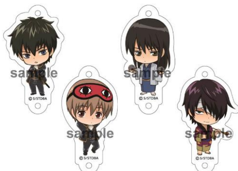
アクリルチャーム／全7種 (各540円) ※ブラインドパッケージ