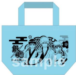
ランチトート／全3種