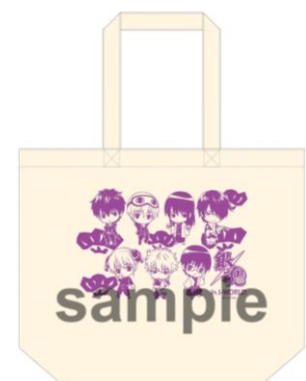
A3 トートバッグ／全1種 (1,944円)