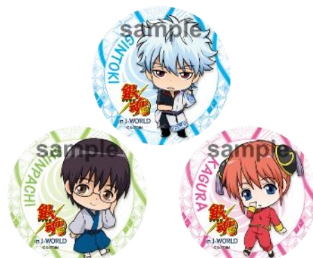
75mm 缶バッジ／全7種 (1個378円) ※ブラインドパッケージ