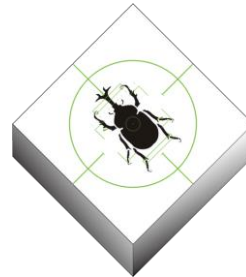
▲『カブトマーク』イメージ

「銀魂エリア」にある“採集エリア”で、『カブトマーク』を見つけたらムシ取り網でタッチ！