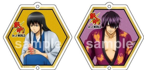
アクリルストラップ／全9種