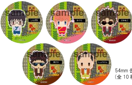
54mm 缶バッジ (全10種)