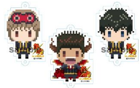
つながるアクリルストラップ (全7種)