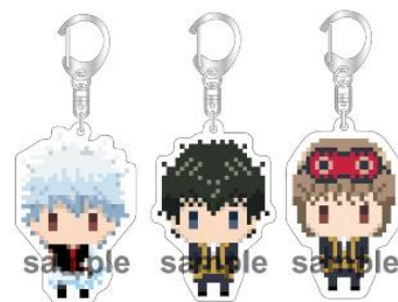
アクリルキーホルダー (全6種/各864円)