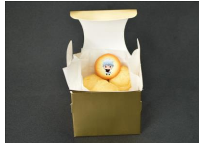
▲裏メニュー「宝箱」(500円) ロシアンシュークリーム。5個中1個があたり。

アトラクション体験後にもらえる「ゲーム攻略本風の冊子」に書かれた“ある呪文”を、J-WORLD KITCHEN カウンターで唱えると、スペシャルメニューが食べられる…らしい！？ 唱える呪文によって味が変わります。