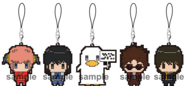
ラバーストラップ (全10種/1個648円) ※ブラインドパッケージ