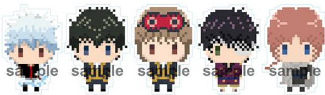
ダイカットポストカード(かみのはがき) (全5種/各270円)