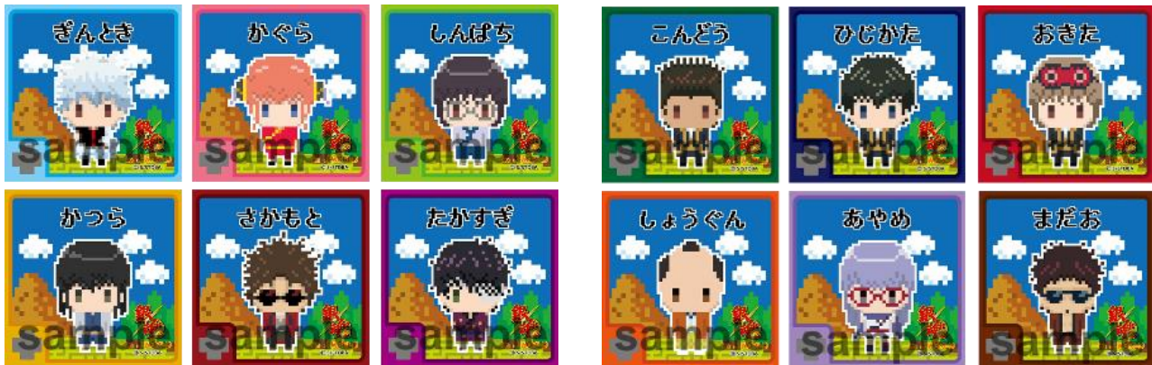
スクエア缶バッジ Ver.1/全10種 (1個378円) ※ブラインドパッケージ