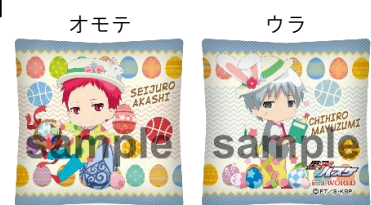
ミニクッションストラップ (全6種)