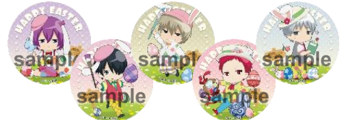
56mm 缶バッジ (全13種)