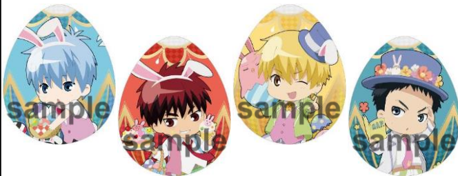
【オリジナルグッズ 一例】 たまご型ミニクッションストラップ/全13種 (各1,080円)