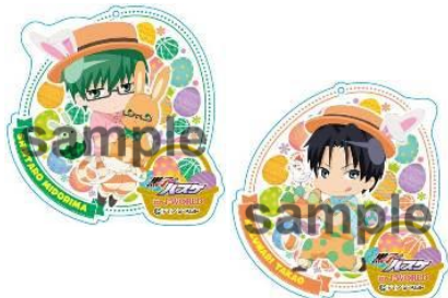
アクリルキーホルダー／全13種 (各 864円)