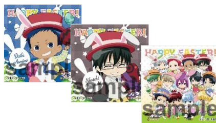
スクエア缶バッジ ver.1[全7種]、ver.2[全7種] (1個 378円) ※ブラインドパッケージ仕様