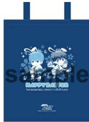
デニムトートバッグ (全6種)