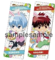
ロングスクエア缶バッジ (全13種)