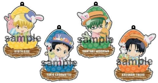
アクリルキーホルダー (全13種)

さらに、期間中に追加景品が登場予定！ 詳細は J-WORLD TOKYO 公式サイトでお知らせします。