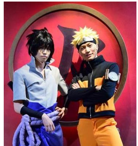
※写真は現在実施している第一弾の『忍戦ツアー』のものです。

※パスポートは園内にあるアトラクション(期間限定アトラクション含む)を当日何度でもご利用いただけるチケットです。