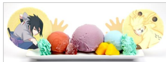
螺旋丸 VS 千鳥の激突アイスプレート (680円)

ナルトが“螺旋丸”、サスケが“千鳥”、それぞれの術を放つ瞬間を、アイスに手形の最中を添えて表現しました。螺旋丸はラムネアイス、千鳥はブラッドオレンジアイスでイメージしています。中央部の大きめの巨峰シャーベットは、ぶつかり合い膨張していく光景を表現しています。