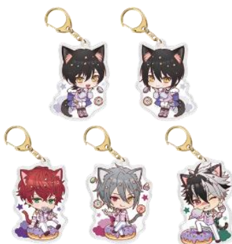
A賞：アクリルキーホルダー (全21種)