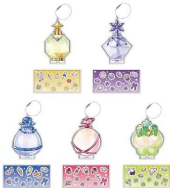
フレームキーホルダー&パーツセット (全5種)