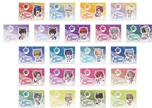
アクリルスタンド (全21種)