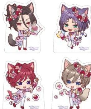
B賞：POPスタンド (全21種) ※ランダム配付