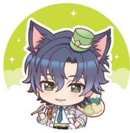
フォーチュンラテ