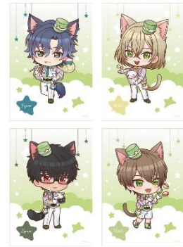
C賞：クリアイラストシート (全21種)