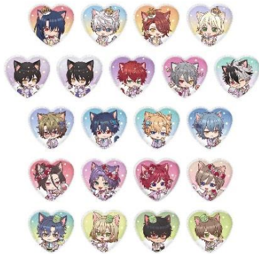
ハート缶バッジコレクション (全21種)