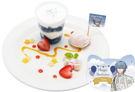
ネロのハッピーバースデープレート