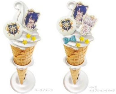
カスタムソフトクリーム