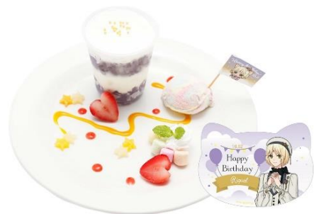
リケのハッピーバースデープレート