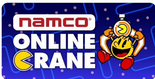
PAC-MAN™ & ©Bandai Namco Entertainment Inc.

株式会社バンダイナムコアミューズメント(本社：東京都港区/社長：川崎寛)は、2024年2月13日(火)にオンラインクレーン「とるも」を「ナムコオンラインクレーン」にリニューアルします。