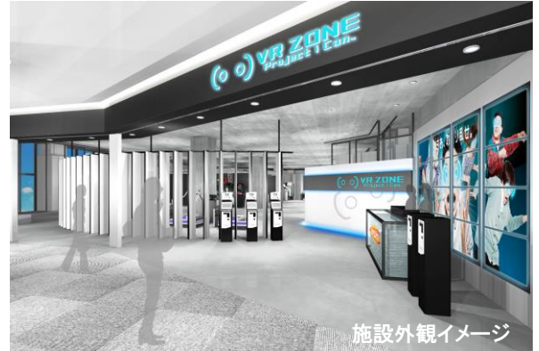
施設外観イメージ

本施設は、大人の「やりたい！けど実際はムリ」な夢や好奇心をホンモノの体験として実現し、多くの人々に驚き楽しんでいただくことを目指す「VRエンターテインメント研究施設」として位置づけ、お客様は“研究の体験者”となって最新のVRアクティビティをお楽しみいただけます。