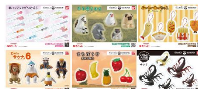
▲オリジナルステッカー(全6種)