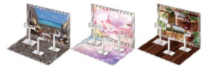
▲おうちでガシャ撮り(全1種) ※付属背景(全3種)

※ニュースリリースの情報は、発表日現在のものです。発表後予告なしに内容が変更されることがあります。あらかじめご了承ください。