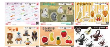
▲オリジナルステッカー(全6種)

https://bandainamco-am.co.jp/others/gashapon-bandai-officialshop/app/