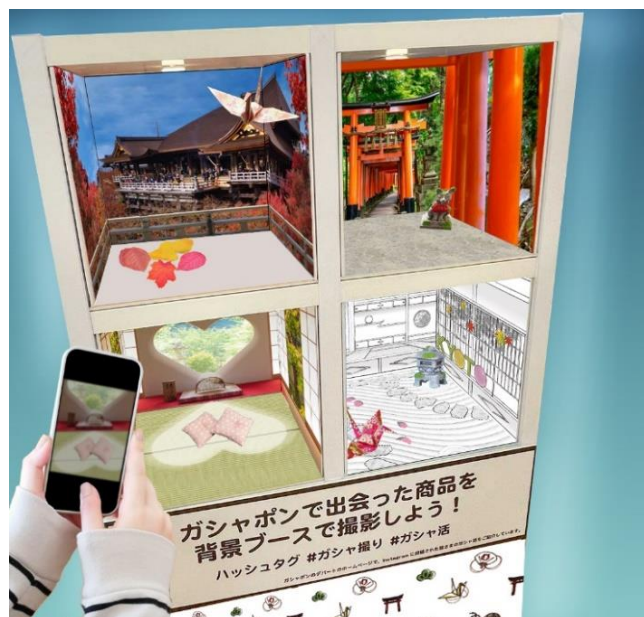
▲ガシャ撮りスポット

店内にはジャパニーズモダンな雰囲気の写真スポットや撮影スポットでガシャポン商品を撮影できるようなガシャ撮りスポットも用意します。カプセルトイの購入を楽しむことに加え、商品とともに思い出をお持ち帰りいただけるよう、カプセルトイを用いた新たな観光名所となるべく、楽しい体験を用意しています。