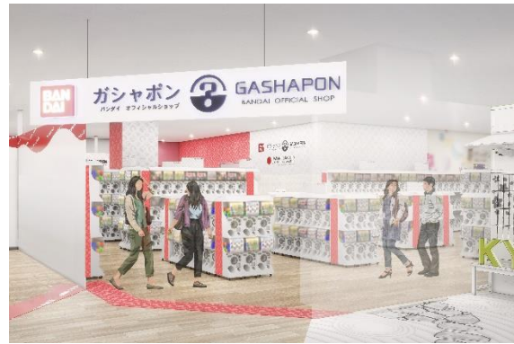
▲『ガシャポン バンダイオフィシャル』イオンモール KYOTO 店