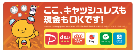
▲ガシャポンステーションW (ダブル) 上段 POP

今回、近年国内外で急増するキャッシュレス決済需要を受けて、現金にもキャッシュレス決済にも対応可能な「ガシャポンステーションW (ダブル)」を多数設置する大型コーナーをイオンモール KYOTO 店内で展開します。PayPay や d 払いといった国内決済ブランドだけでなく WechatPay や支付宝 (ALIPAY) といった海外決済ブランドにも対応し、より海外のお客さまにも手軽にバンダイのガシャポン商品を購入できるコーナーです。利用可能な決済方法は以下です。