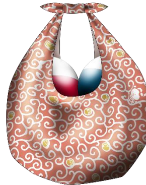
▲ガシャポン バンダイオフィシャルショップイオンモール KYOTO 店 オリジナル和柄ふるしき(全1種)