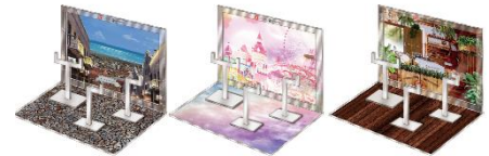
▲おうちでガシャ撮り(全1種) ※付属背景(全3種)

その弐 11月2日(水)から開催! 店頭にて「ツイッターフォロー&リツイートキャンペーン」