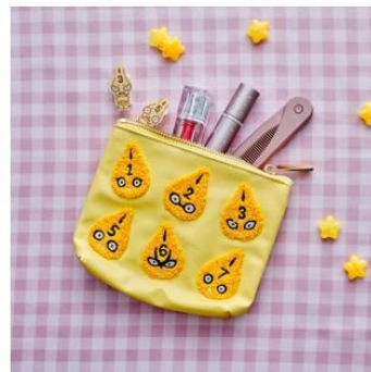
ピストルズのポーチ(全1種) 価格：2,500円