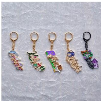
モチーフキーホルダー(全5種) 価格：各1,800円