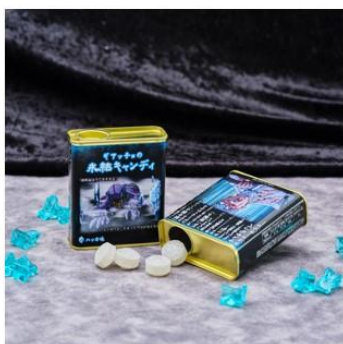
ギアッチョの氷結キャンディ(全1種) 価格：700円