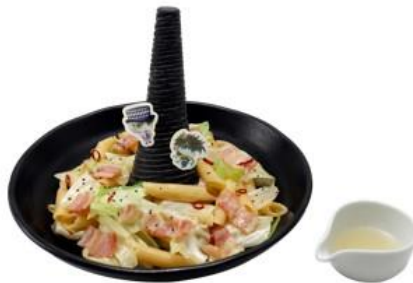
ヘルクライム・ピラーのマカロニサラダ 価格：1,900円