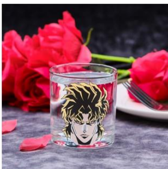
肉体.....来たか...グラス(全1種) 価格：2,200円