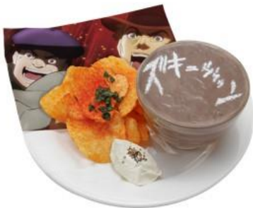
おれたちにできない事を 平然とやっつてのけるココアセット 価格：1,100円