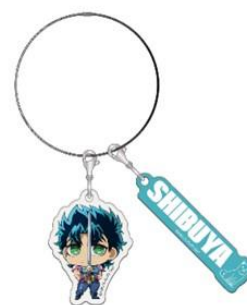
地域限定ワイヤーキーホルダー(全12種) 価格：各1,200円