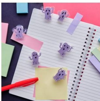
Mtのクリップセット(全1種) 価格：1,800円