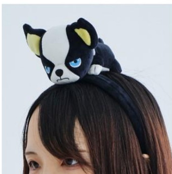
イギーのカチューシャ(全1種) 価格：3,300円