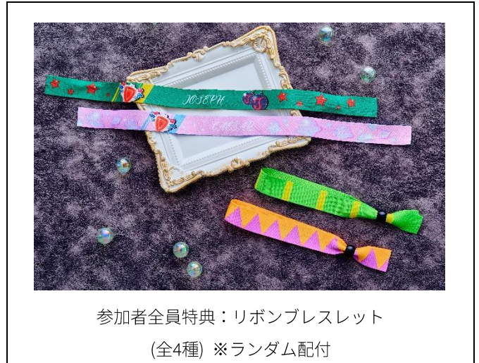
参加者全員特典：リボンブレスレット (全4種) ※ランダム配付