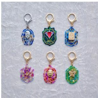
アイコンキーホルダー(全6種) 価格：各1,650円