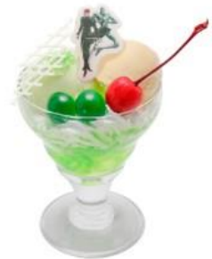
ハイエロファントグリーン のエメラルドスブラッシュパフェ 価格：1,200円