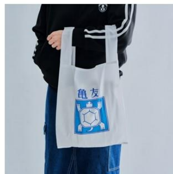
亀友エコバッグ(全1種) 価格：2,200円