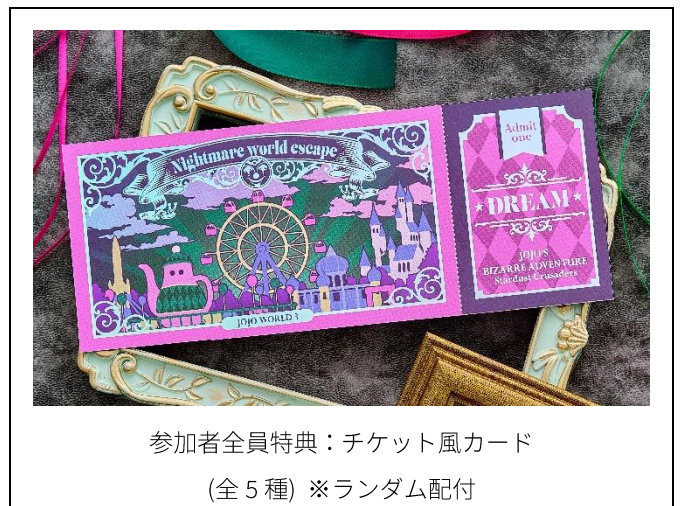
参加者全員特典：チケット風カード (全5種) ※ランダム配付

※インフォメーションの情報は発表時現在のものです。発表後予告なしに内容を変更、中止することがあります。※画像はイメージです。