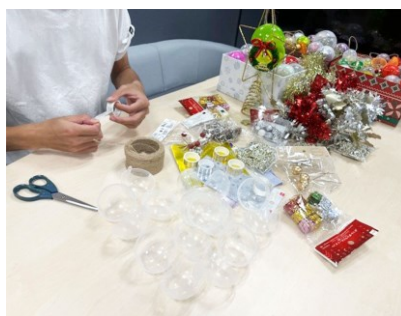
▲キャンペーン期間中、当社本社にクリスマスツリーを設置。通常店舗にて廃棄・リサイクルしている空カプセルを使用してオーナメントを手作りしたクリスマスツリーです。