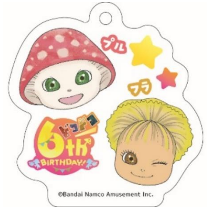
アクリルキーホルダー イメージ