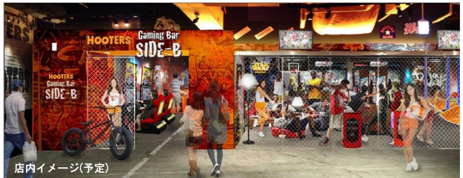
店内イメージ(予定)

『GAMING BAR SIDE-B』は、ナムコのテーマパークやアミューズメント施設の企画運営ノウハウと、HOOTERSのホスピタリティあふれる米国流接客や飲食ノウハウを集結させた新趣向の「インタラクティブスポーツバー」です。