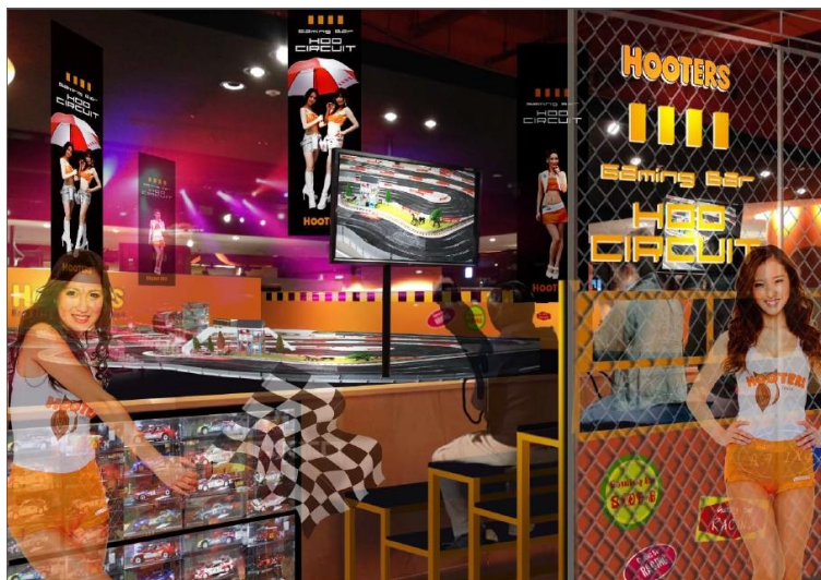
都内最大級のスロットカーコース“渋谷サーキット”も登場！