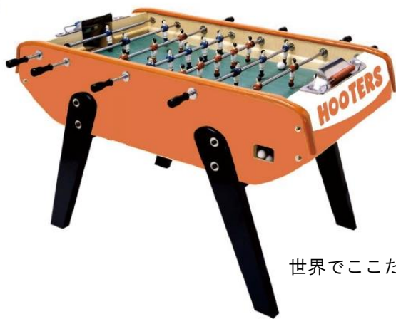
世界でここだけの HOOTERS カラーサッカーゲーム！