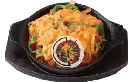
アンツィオの鉄板ナポリタン 1,200 円/税込