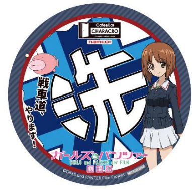
【ドリンク例】戦車道、やります！ 700 円/税込 ※ストローアクセサリ&コースター付