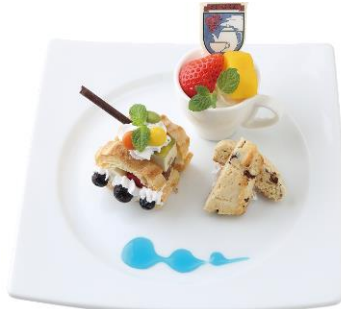
聖グロリアーナのティーパーティ 1,100 円/税込