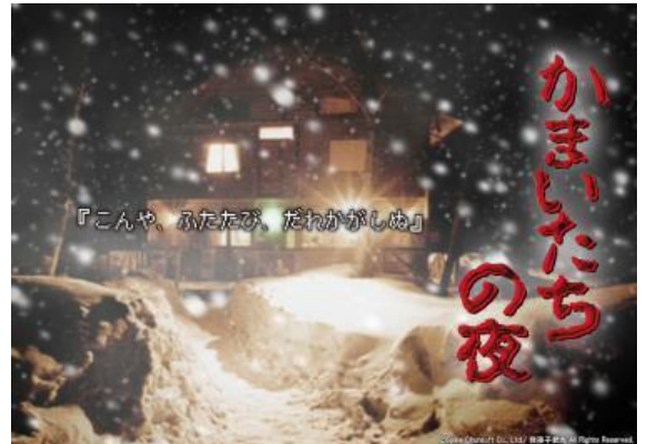
©Spike Chunsoft Co., Ltd. / 我孫子武丸 All Rights Reserved.

オープンに合わせて登場する新コンテンツの目玉となるのは、伝説のミステリーゲームソフト『かまいたちの夜(*1)』のアナザーストーリーをリアル体験できる「パーティCUBE」。真冬の雪山のペンションを舞台に起こる不可思議な殺人事件の謎を解明する大人気サウンドノベルをリアルに再現。1人で遊ぶ“ゲームソフト”をリアルゲーム化することで、同時に4人で協力しながらミッションクリアを目指し、作品のストーリーを体験することが可能となりました。