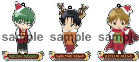
アクリルキーホルダー(全13種)