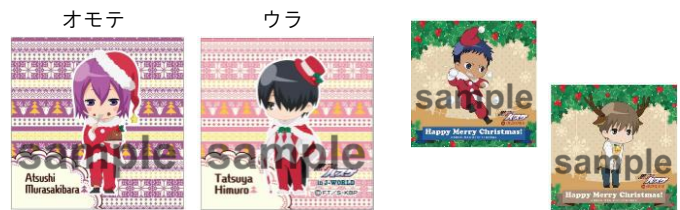
[成功賞] ミニクッションストラップ(全6種)