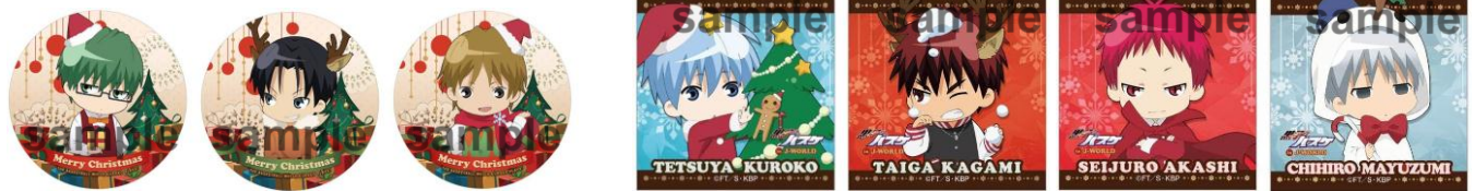
クッションストラップ (全13種/各1,080円)