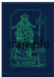
パスケース (全3種/各1,728円)