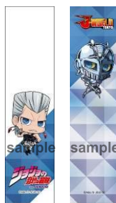
クリアブックマーカー 2枚セット (全7種/各540円)