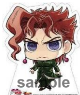
ポップスタンド(全14種)