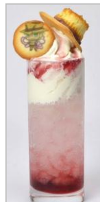
[左] ジョセフ・ジョースターのハーミットパープル(隠者の紫)ドリンク [中央] イギーのザ・フル(愚者)ドリンク