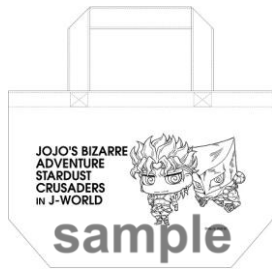
ランチトート(全7種)