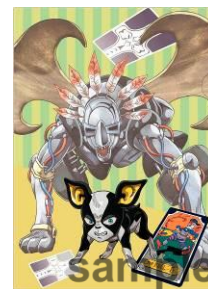
A4 クリアファイル (全7種/各378円)