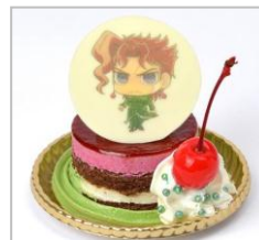
花京院典明のレロレロサワー チェリーケーキ (740円)

©荒木飛呂彦/集英社・ジョジョの奇妙な冒険製作委員会 ©荒木飛呂彦&LUCKY LAND COMMUNICATIONS/集英社・ジョジョの奇妙な冒険 SC 製作委員会 ©LUCKY LAND COMMUNICATIONS/集英社 ©BANDAI NAMCO Entertainment Inc.