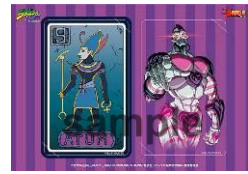
クラッチバッグ & IC カードステッカー(全7種)