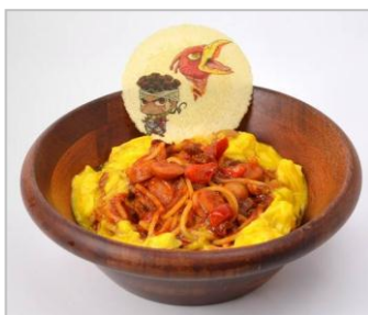
アヴドゥルの マジシャンズレッド(魔術師の赤) アラビアータ (880円)

意外な素材の夢のタッグバトル！！組み合わせると美味しいコンセプトメニューが登場！ フードとドリンクなどを自由に組み合わせると完成させよう。