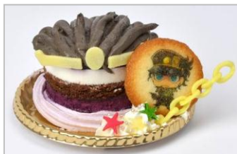
スタープラチナ(星の白金)の オラオラブルーベリーケーキ (780円)