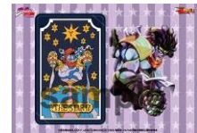
クラッチバッグ & ICカードステッカー(全7種)