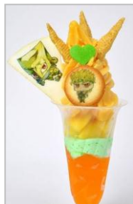
DIOの ザ・ワールド(世界)パフェ (800円)