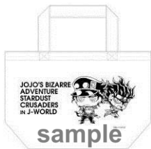
ランチトート(全7種)