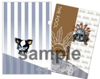
A6 クリアファイル&クリアポストカードセット (全7種)