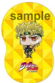
ダイカットクッション (全1種/各1,980円)