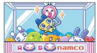
[ミニゲーム] ナムコクレーン