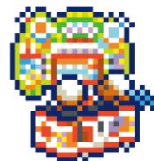
[おどろぐ] たいこのたつじん