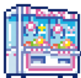
[おどろぐ] クレンゲーム