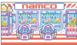
[リビング] ナムコリビング