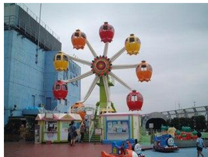
2代目「グレ太の観覧車 フラワーホイール」 (1989～2014年)