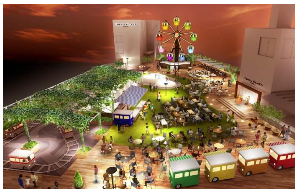
リニューアルオープン後 屋上イメージ 2014年10月9日～