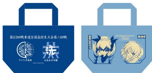
B 賞トートバッグ（2 種類）