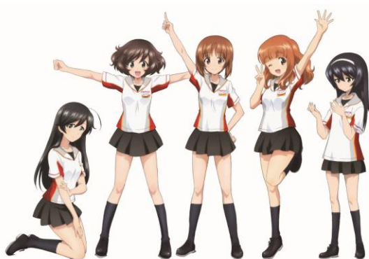
©GIRLS und PANZER Projekt