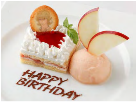
期間限定メニュー「バーナビーのバースデーケーキ」 ※販売期間 11月13日(水)まで

「バーナビー誕生祭」 開催期間：2013年10月31日(木)～11月13日(水)