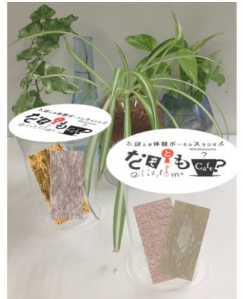
商品はイメージです

当社プロデュースの謎とき情報ポータルサイト「なぞとも」でも評判の高い、個性あふれる人気の謎制作団体の自慢の技を盛り込んだ完全オリジナルの謎ときが続々登場予定で、その場でカップに詰めてご提供いたします。