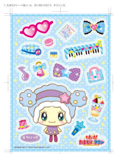
「でかたまもりしーる」