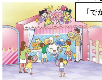
「でかたまもルーム」

※「たまもルーム」をお子様の等身大サイズで再現した「でかたまもルーム」で遊ぶことができます。