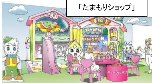
「たまもりショップ」