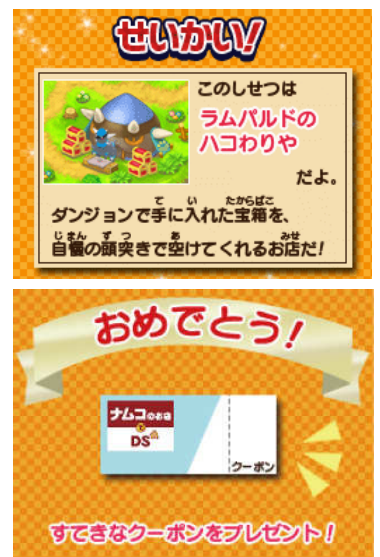
ナムコのお店でDS 「ポケモンダンジョン間違い探し」クイズ画面

「ニンテンドーゾーン」について 「ニンテンドーゾーン」とは、任天堂株式会社の携帯ゲーム機「ニンテンドーDS シリーズ(3DSLL, 3DS, DSiLL, DSi, DS Lite, DS)」のWi-Fi通信を利用したネットワークサービスです。 「ニンテンドーゾーン」対象エリアでは、任天堂株式会社の携帯ゲーム機「ニンテンドーDS シリーズ」を持参するだけで、特別な設定をすることなく、オリジナルコンテンツを遊んだり、ソフトの体験版をダウンロードしたり、ニンテンドーe ショップやニンテンドーDSi ショップに接続して、ダウンロード専用ソフトを購入したりすることができます。